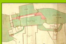
Moulins de Brebières